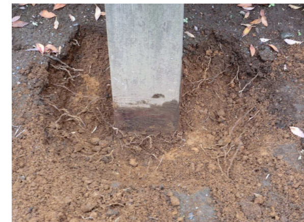
支柱:レッドウツ 90×90 最も過酷な地際部の腐食もない。