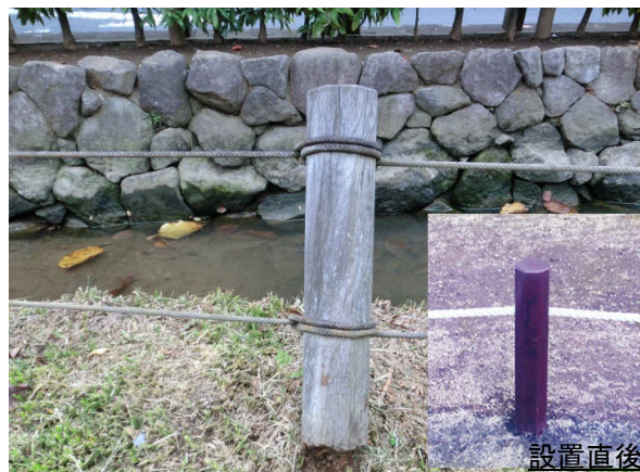
ボンゴシのロープ柵 同時期に設置したボンゴシは全て腐食。