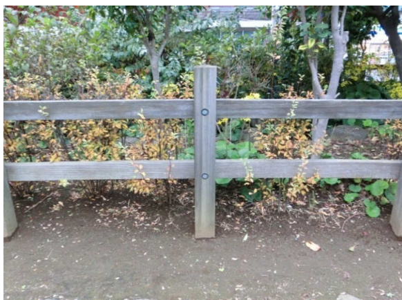
19年経過しても紫外線による退色以外は殆ど変わらない。ノーメンテナンス30年がみえてきました。